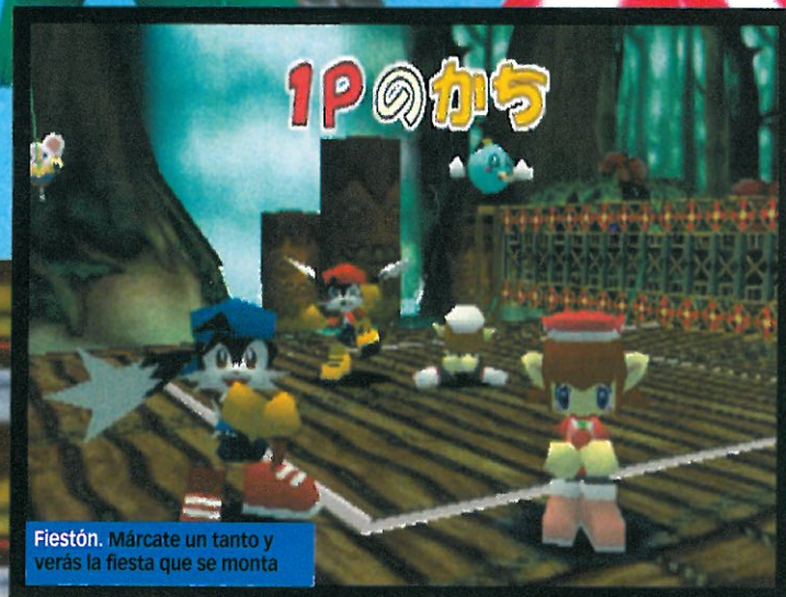
Fiestón. Márcate un tanto y verás la fiesta que se monta

« Un simulador de deportes muy rápido, con un montón de movimientos potentes y acción desenfrenada de vóleibol dos contra dos a punta pala »