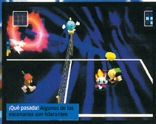
¡Qué pasada! Algunos de los escenarios son hilarantes

VOLEY GATO Este felino veterano de las plataformas centra ahora su atención en el circuito de voley playa.