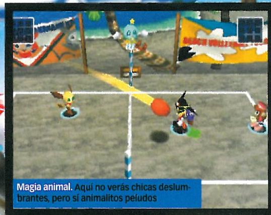
Magia animal. Aquí no verás chicas deslumbrantes, pero sí animalitos peludos