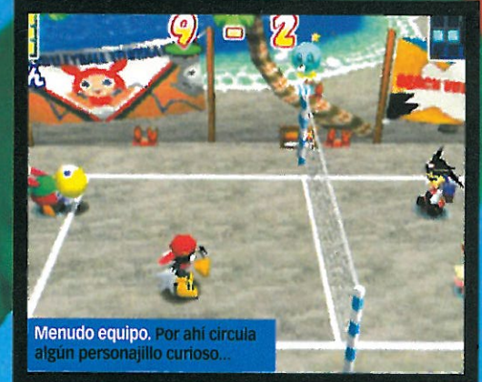
Menudo equipo. Por ahí circula algún personaje curioso...