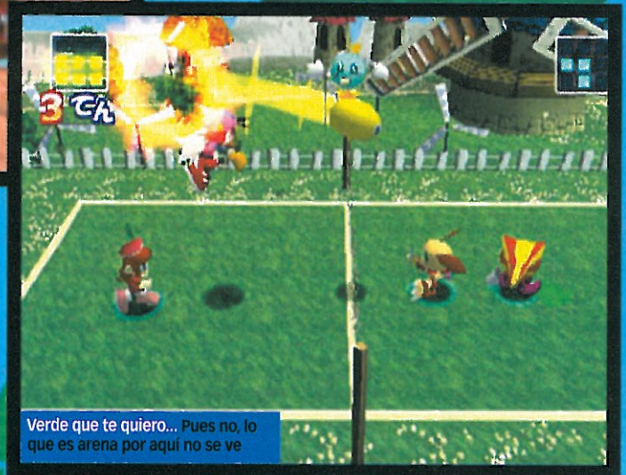
Verde que te quiero... Pues no, lo que es arena por aquí no se ve

« Un simulador de deportes muy rápido, con un montón de movimientos potentes y acción desenfrenada de vóleibol dos contra dos a punta pala »