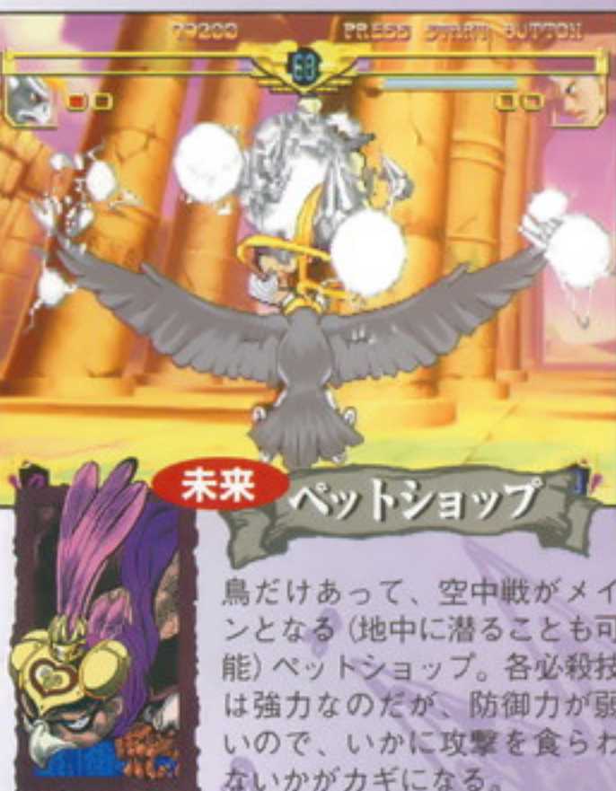
未来 ペットショップ

プレイヤーキャラのヴァニラ・アイスは、CPU戦時のように、必殺技すべてがガード不能ということはないが、ヒット時の威力は絶大。空中ダッシュを何度もできる能力もある。