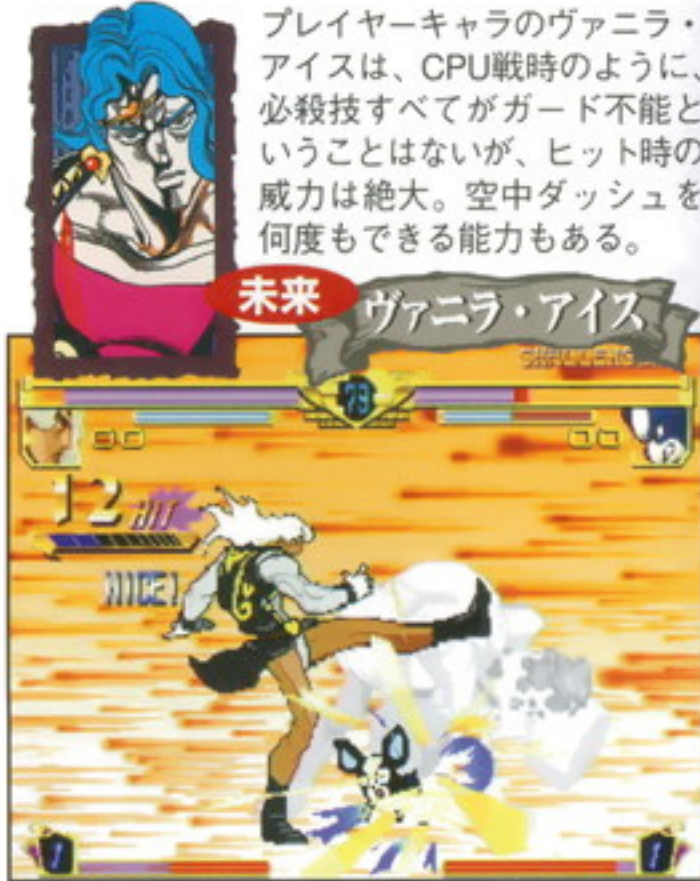
未来 ヴァニラ・アイス

承太郎たちが目指す最終目的のディオは、「血の召還」という新技を修得。コマンド入力後に相手に体当たりをし、ヒットすると写真のような衝撃的な演出の技を繰り出す。