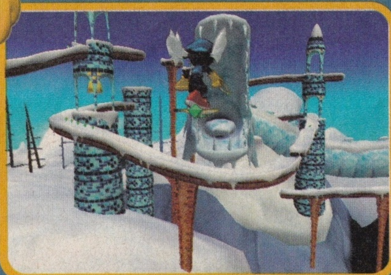
Polatajmy trochę! Takich, przyjemnych urozmaiceń w grze jest naprawdę sporo!