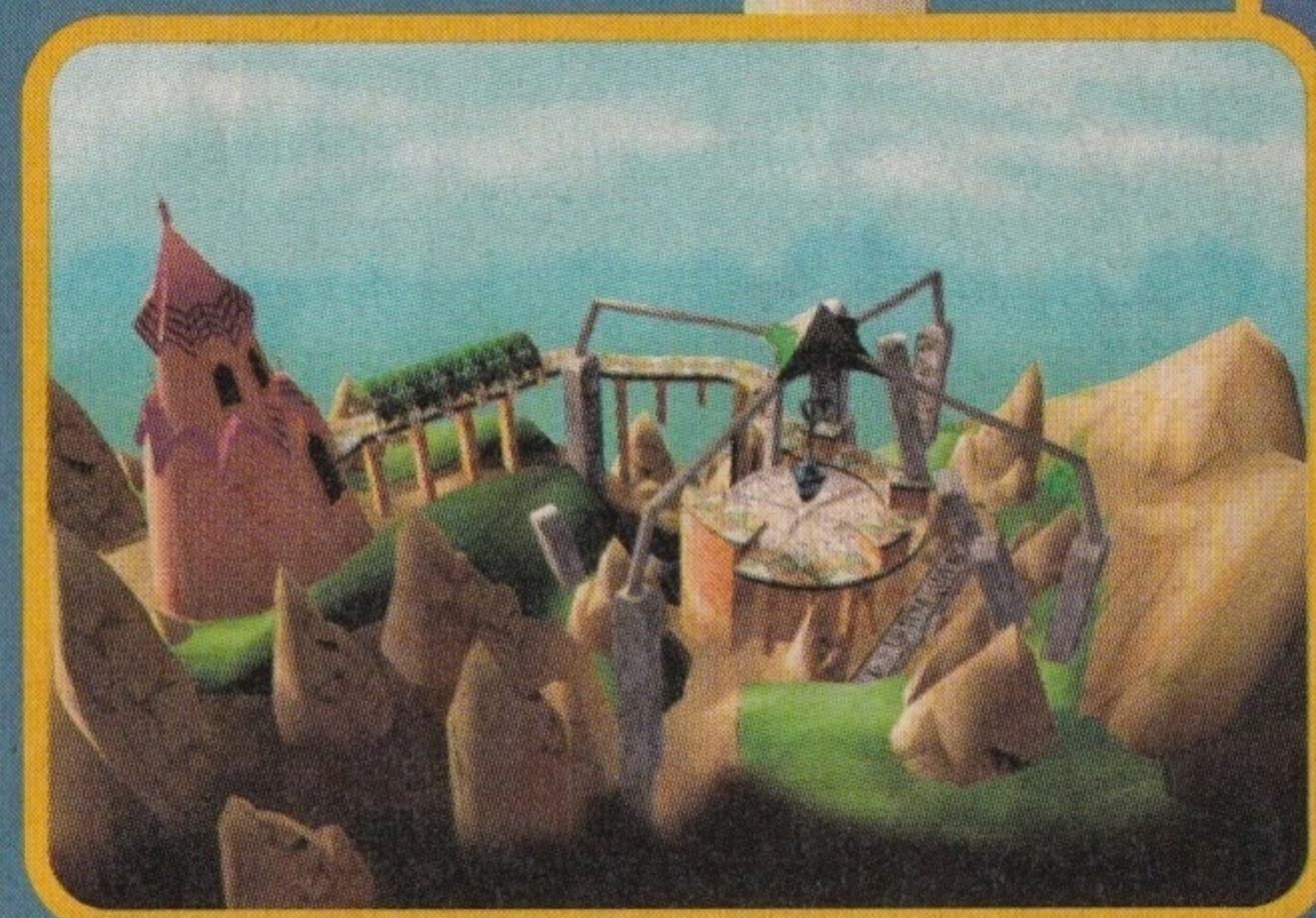
Szybka akcja wymaga zręcznych paluszków. Oczywiście, co to dla ciebie...

biegnie, kręci się, łapie wrogów, rzuca nimi, fruwa w powietrzu i jest wystrzeliwany bardzo wysoko, aby spaść idealnie na dalszą część plan-