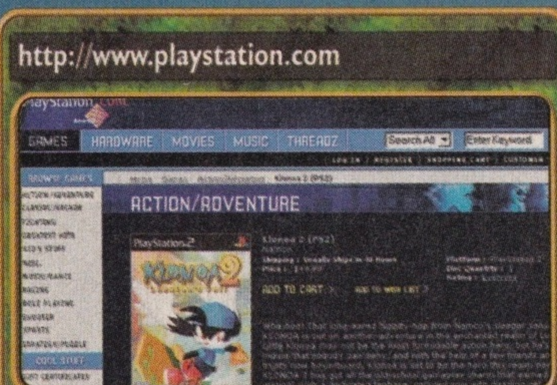
Na oficjalnej stronie PlayStation znajdziesz kilka informacji na temat gry. Niestety, KLONOA 2 nie ma swojej własnej strony