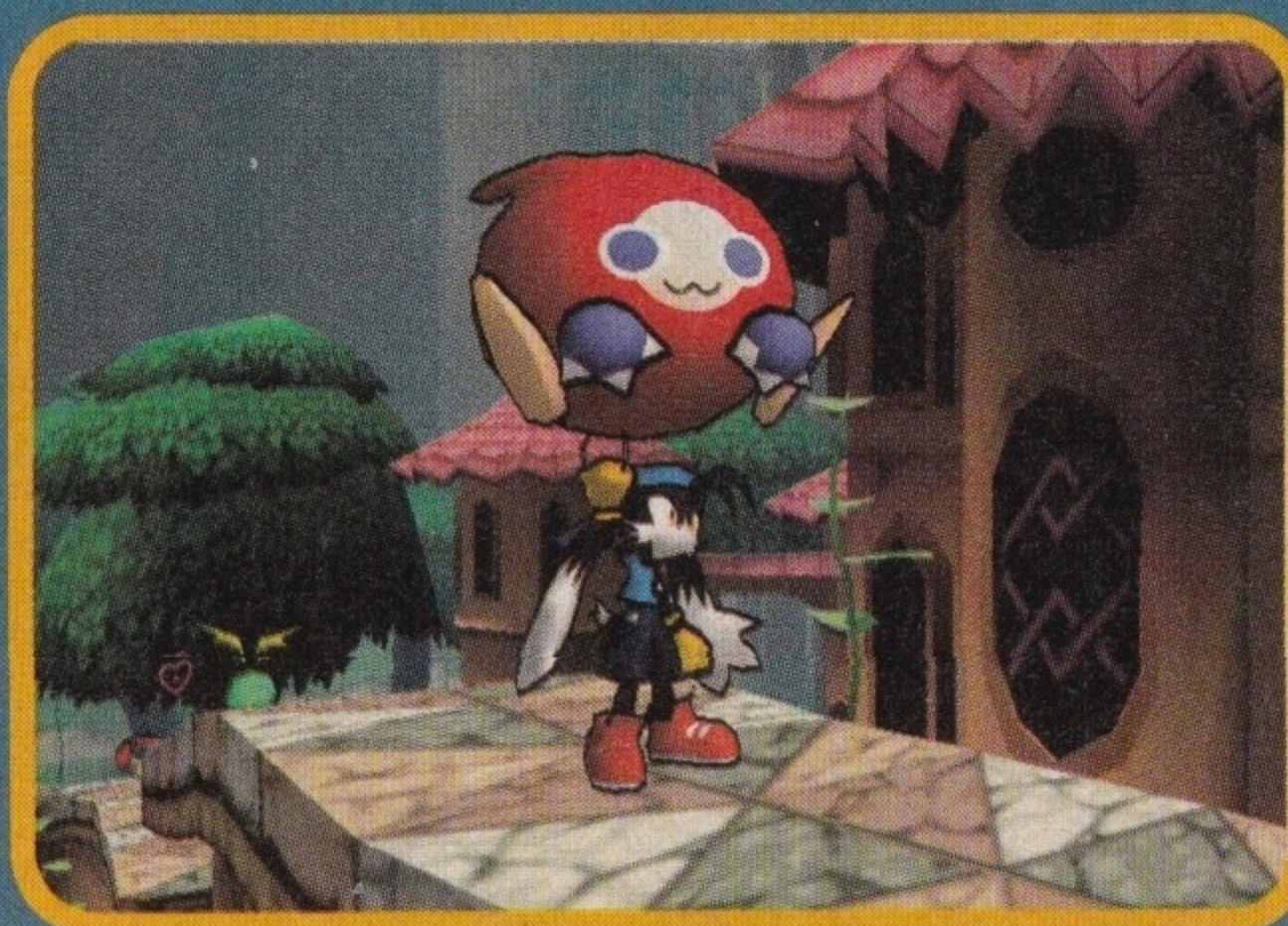
Uśmiech, proszę! Za chwilę otworzą się drzwi i czeka cię wielka niespodzianka

W porównaniu z częścią pierwszą, KLONOA 2 jest bardziej dy-