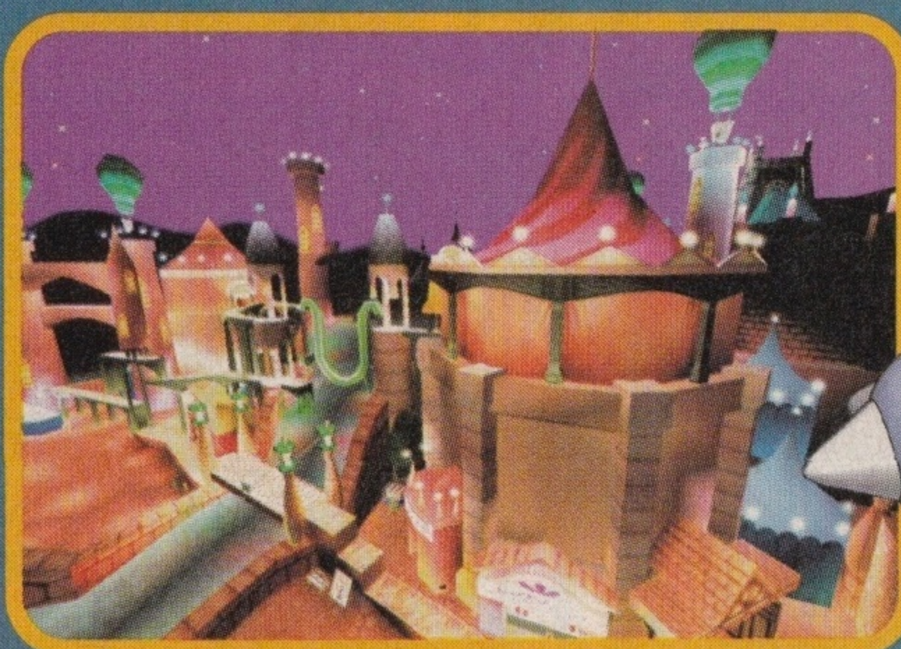
Efekty specjalne robią wrażenie. Bogactwo barw zadowoli nie tylko najmłodszych graczy