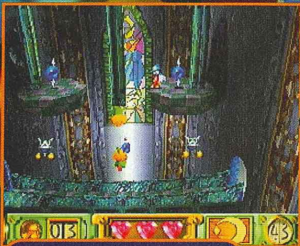
Pour sortir, il faut taper dans les trois perles bleues en moins de cinq secondes. Dur dur...