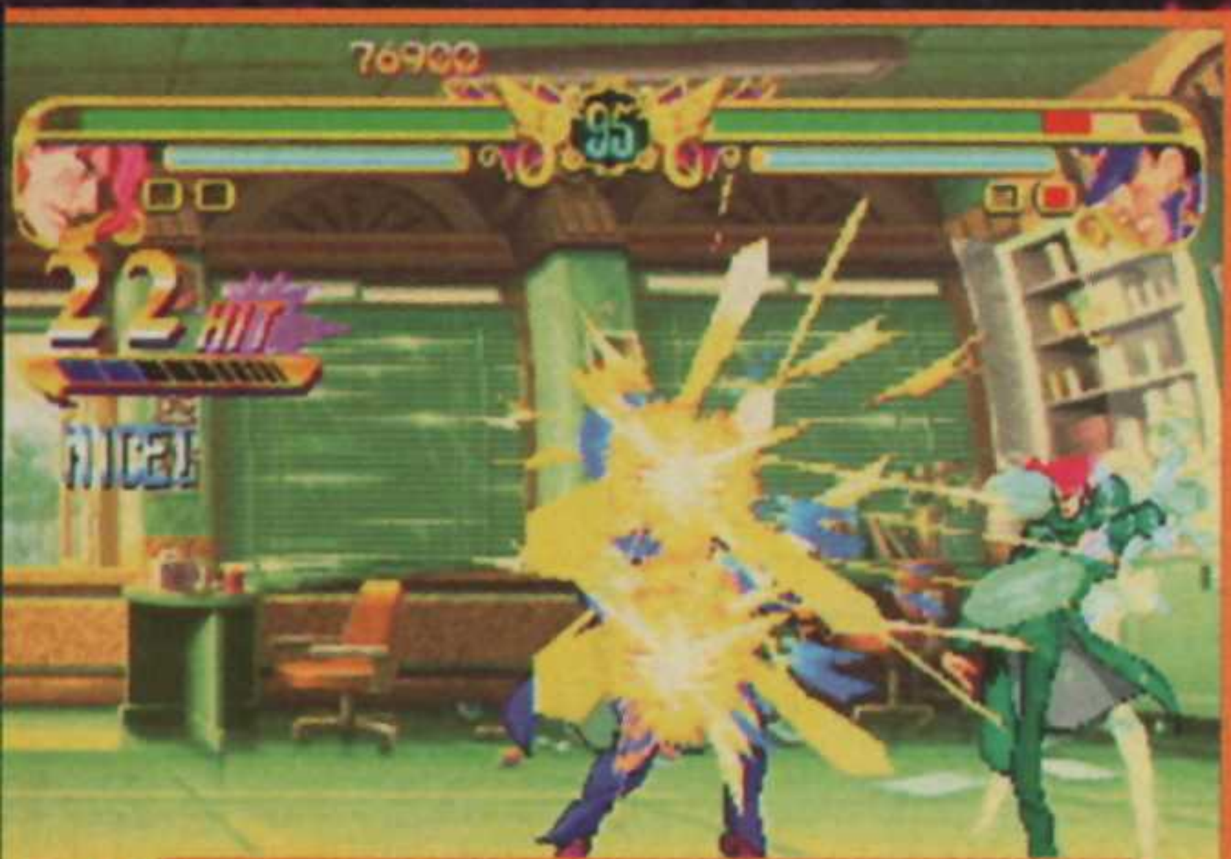
Classiquement, une barre de Power se charge, permettant de réaliser des Furies.