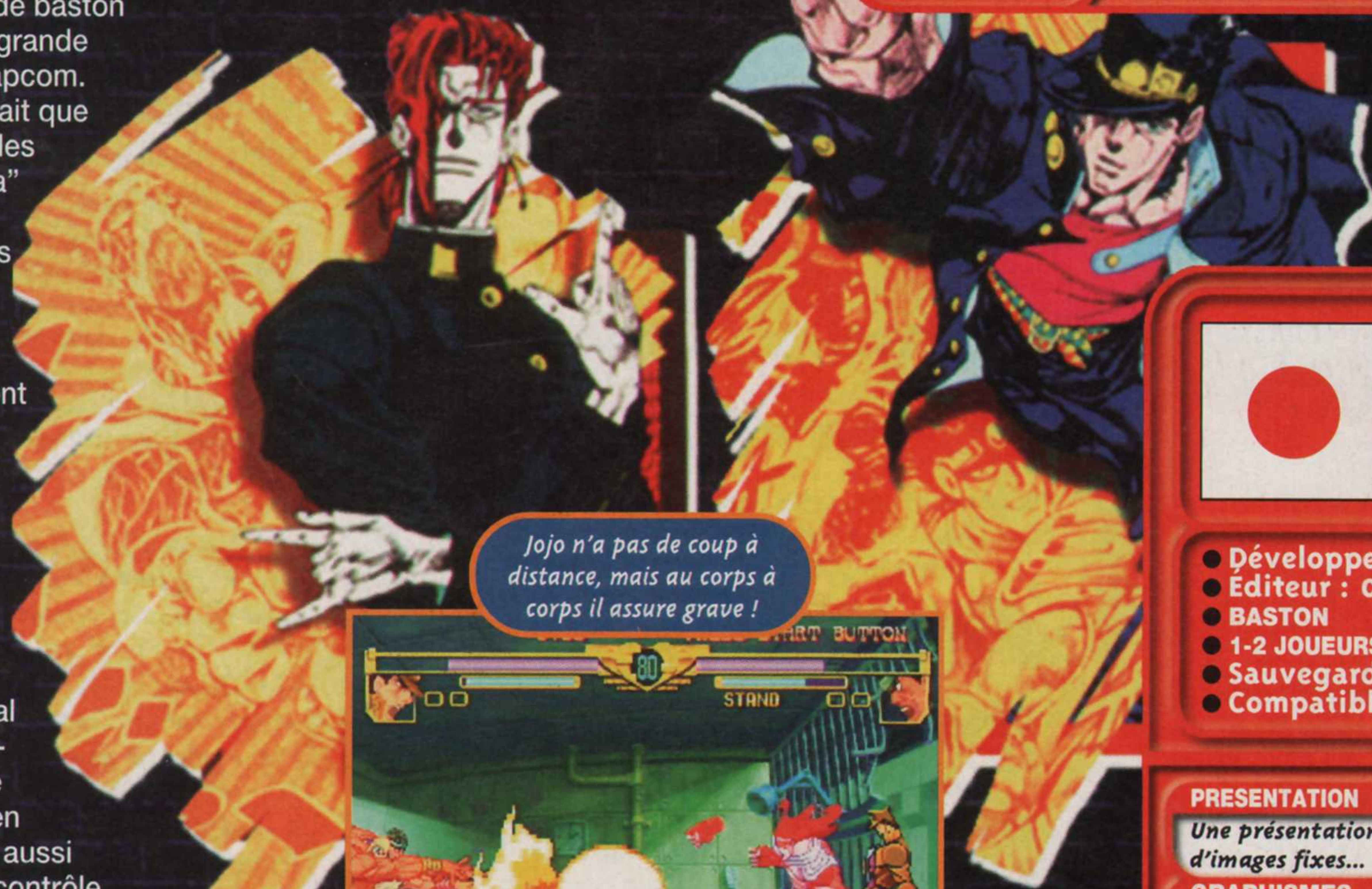
Jojo n'a pas de coup à distance, mais au corps à corps il assure grave !