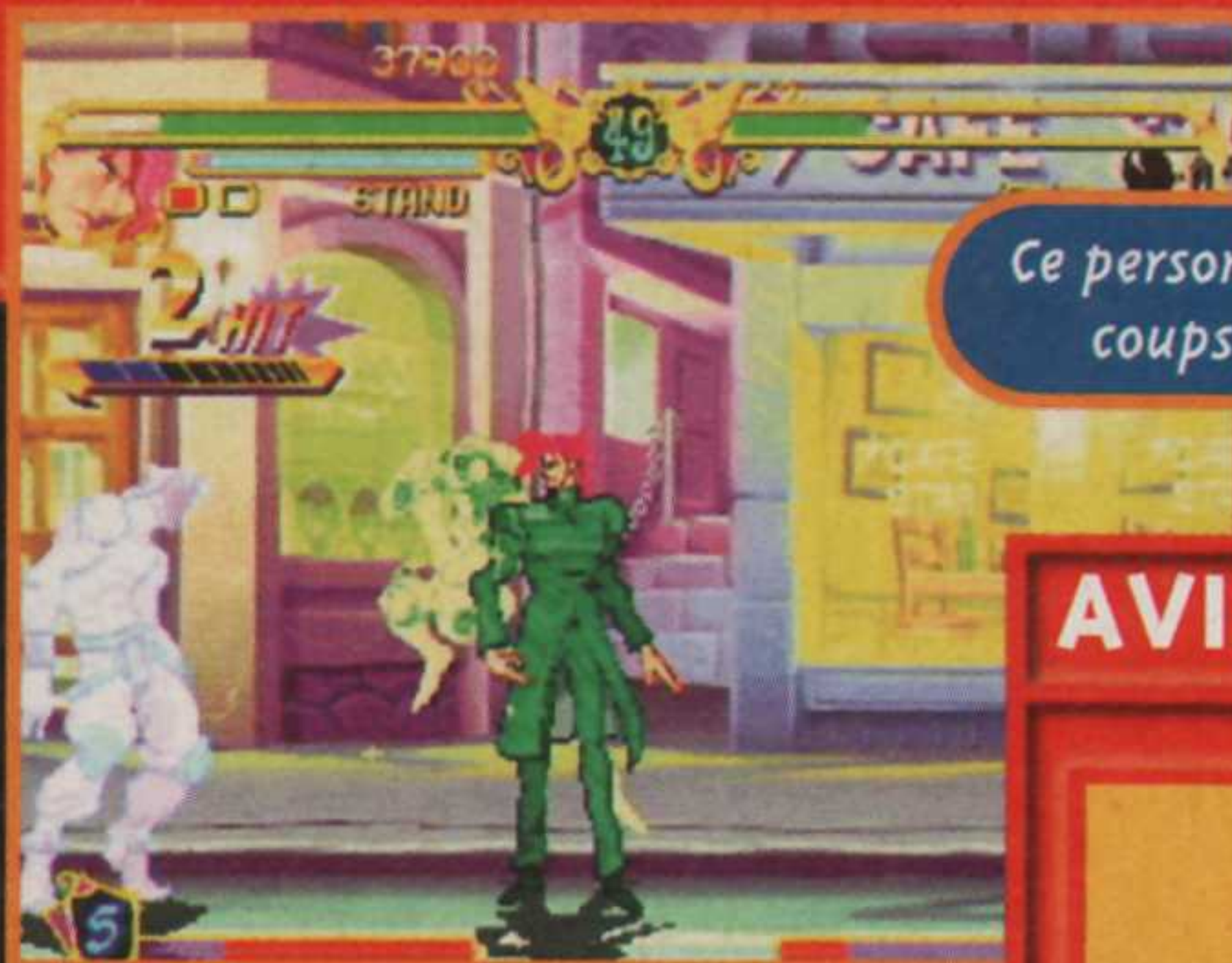
Ce personnage possède des coups très défensifs.

J ojo est un jeu de baston en 2D dans la grande tradition de Capcom. Son originalité tient au fait que dans la série "animée", les héros utilisent leur "aura" pour se battre. Ce principe a bien sûr été repris pour ce jeu de baston. Chaque combattant a des coups "normaux" et des "spéciaux" qui font apparaître son aura. Vous pouvez aussi la faire apparaître, et la garder à votre côté ; ce qui permet de réaliser des coups doubles, puisque votre aura, comme votre ombre, répète vos coups. L'idéal étant de coincer l'adversaire entre vous et votre ombre pour le prendre en sandwich. Vous pouvez aussi prendre directement le contrôle de votre aura, mais, dans ce cas, vous laissez votre corps immobile et vulnérable. On notera un mode Story bien étoffé, avec quelques petits jeux d'action en sus. Dernier bon point : vous avez deux jeux pour le prix d'un, puisque les deux versions arcade sont incluses.