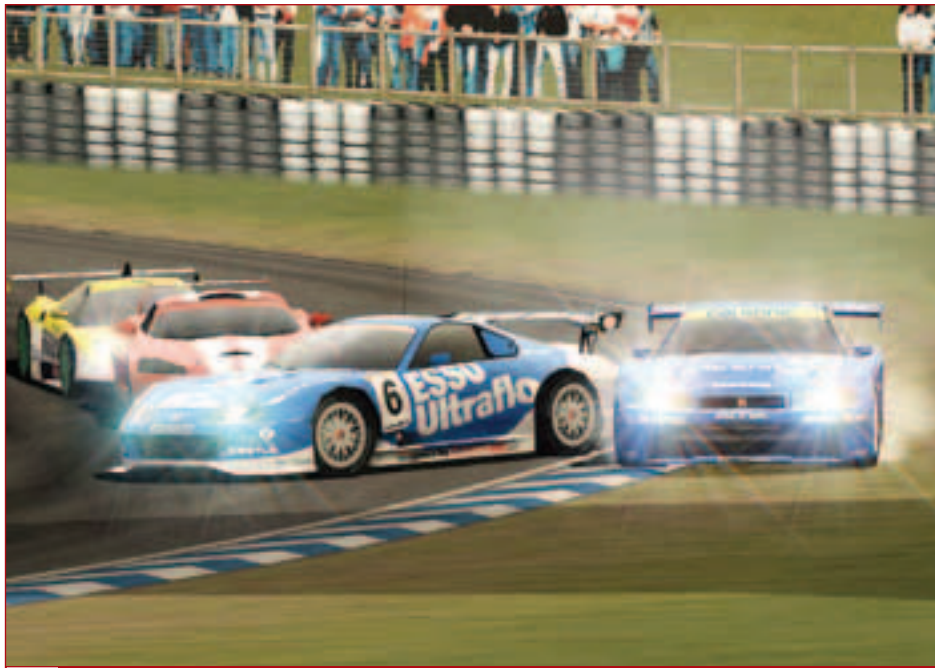
▶ Подобные эффектные сцены в R: Racing Evolution на самом деле редки – этот скриншот предоставлен прессе издателем. Но все честно: и модельки машин, и зрители на заднем плане в игре именно таковы.