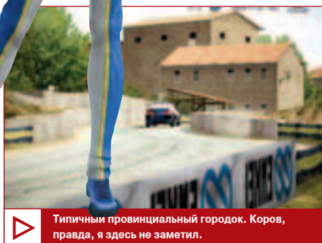
Типичный провинциальный городок. Коров, правда, я здесь не заметил.