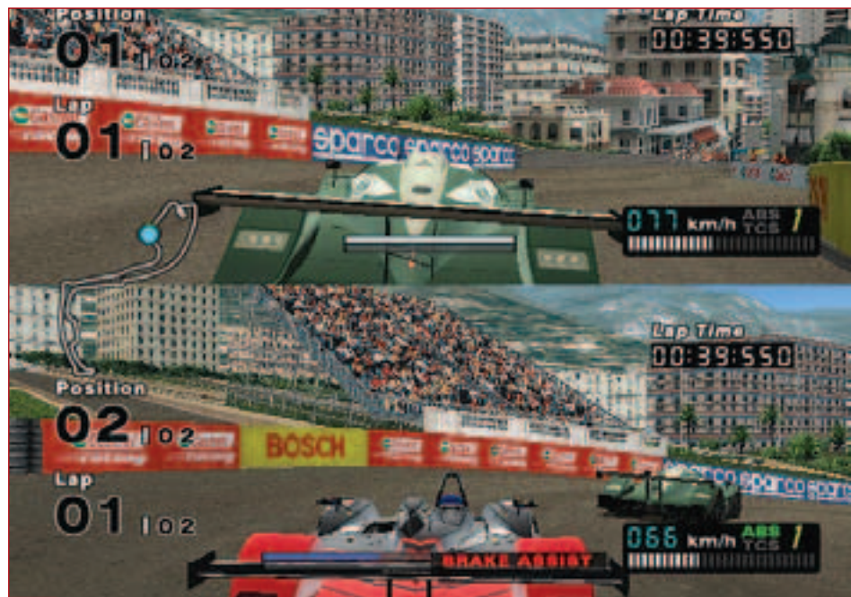
Сетевого режима нет, однако погонять вдвоем можно и в режиме split-screen. Впрочем, R: Racing – в первую очередь игра однопользовательская, это следует обязательно учитывать при покупке.