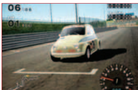
Не бойтесь, этот Fiat только с виду неказист, на деле же он может показать кузькину мать даже