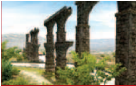
▶ Перед каждым заездом камера наглядно демонстрирует местные красоты.